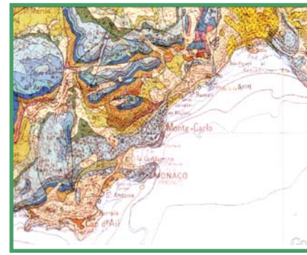
Carte géologique des environs de Monaco

le bassin versant de Monaco fait partie de l'Arc de Nice, structure complexe formée d'écaillés calcaires superposées et parcourue de failles. On y observe une alternance de calcaires compacts et de dolomies jurassiques , notamment sur le Rocher de Monaco et au Jardin Exotique, et de terrains marno-calcaires crétacés , dans les vallons de Moneghetti et de la Rouse.