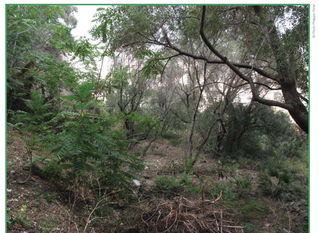
Friche en sous-bois sur les glacis du Palais princier