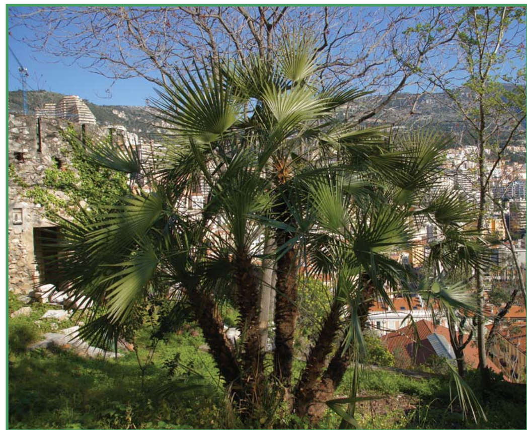
Palmier nain à Monaco

En outre, la Principauté se situe dans l'étage de végétation thermo-méditerranéen , caractérisé par une moyenne des minima de température supérieure à 3°. La végétation naturelle est dominée par l'Olivier sauvage, le Caroubier, le Lentisque, le pin d'Alep, le Palmier nain, et surtout l' Euphorbe arborescente , plante caractéristique des milieux thermo-méditerranéens rocaillieux. En France, cet étage de végétation n'existe que sur la Côte d'Azur, où il est généralement très dégradé par l'urbanisation.