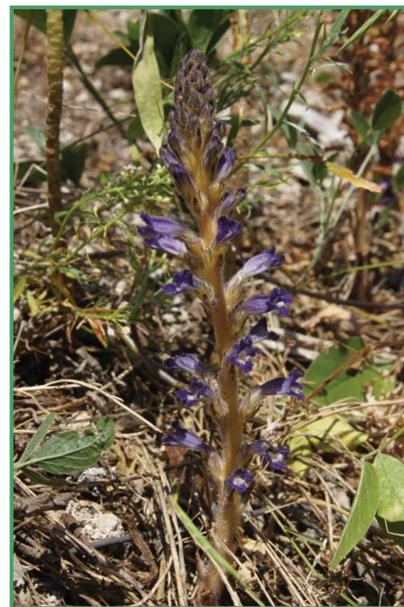
Phelipanche lavandulacea, une plante très rare présente à Monaco

Les Alpes maritimes et ligures sont reconnues comme l'un des dix "hotspots régionaux" de la biodiversité, tant végétale qu'animale. En dépit de son territoire exigu et presque totalement urbanisé, la Principauté de Monaco en abrite encore une part non négligeable : les inventaires menés entre 2008 et 2011 ont permis de recenser