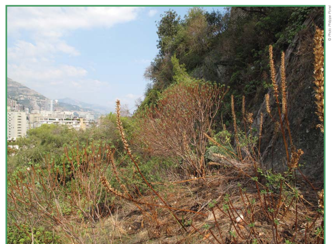
Acanthes sèches et Euphorbes arborescentes sur le Rocher